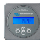
Tableau de commande Phoenix Inverter

Ce tableau peut être également utilisé avec un chargeur-convertisseur MultiPlus, lorsque la commutation automatique est requise mais pas la fonction chargeur. La luminosité des LED est automatiquement réduite pendant la nuit.