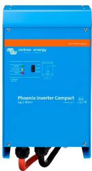
Phoenix Inverter Compact 24/1600

Les possibilités des convertisseurs puissants en parallèle sont réellement surprenantes. Pour en savoir plus sur les batteries, les configurations possibles et des exemples de systèmes complets, veuillez consulter notre livre « Energie Sans Limites » (disponible gratuitement chez Victron Energy et en téléchargement sur www.victronenergy.com ).