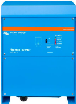
Phoenix Inverter 24/5000